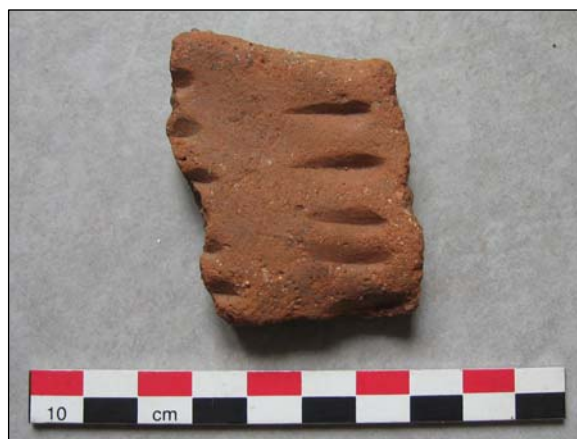
Céramique à décor en « grain de riz »

Prochaine campagne : du 3 au 14 août 2009